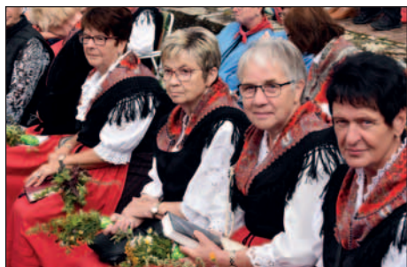
Die froh gestimmten Frauen von der Trachtengruppe „Ellertal“ aus Weißenborn-Lüderode.