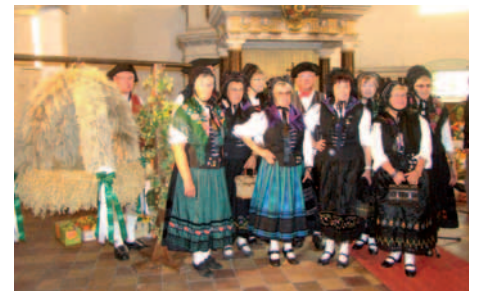
Festgottesdienst mit Trachtengruppe Mihla