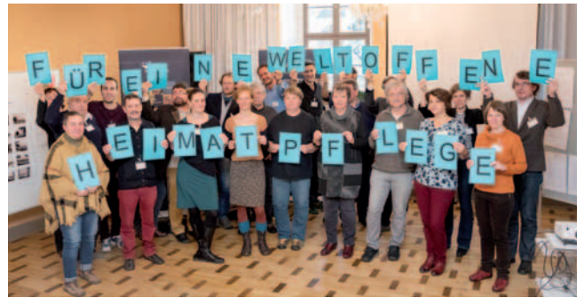
Der Heimatbund Thüringen und seine Gäste zur PARTHNERplus-Veranstaltung

Vorgestellt und ausgewertet wurden auch die mehr als 40 Veranstaltungen zur „Willkommenskultur“. Bereits im April des Jahres fand hierzu in Neckeroda im Weimarer Land ein Interkultureller Dialog beim Verein Thüringer Färberdorf Neckeroda statt, bei dem sich Einheimische, Gäste der polnischen Partnergemeinde und eine geflüchtete Großfamilie aus Afghanistan trafen. Für 2017 ist eine Fortführung des erfolgreichen Projektes vorgesehen. Interessierte haupt- und ehren-