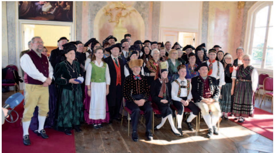
Die Tagungsteilnehmer lächelten zum Schluss in die Kamera

Im nächsten Jahr wird es wieder ein Podium für die Tracht an ihrem Ehrentag geben, dann treffen sich am 15. Oktober 2017 im Wechmarer Gemeindesaal die Thüringer Trachtler und dann geht es um das „Spinnen in Thüringen“ mit dem 6. Thüringer Wettspinnen und natürlich einer Diskussionsrunde mit Gesprächspartnern auf die wir uns schon heute freuen.