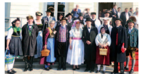
Deutsche Trachtendelegation vor Schloss Bellevue

Aber auch wir haben Bilder von und mit verschiedenen Stars wie Stern TV-Modera-