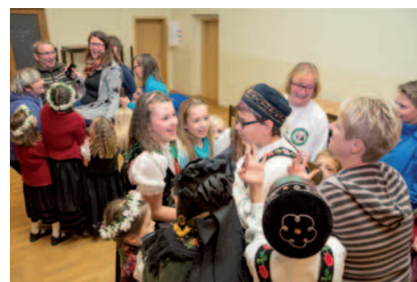
Geburtstagsständchen für Ferienlagerteilnehmer