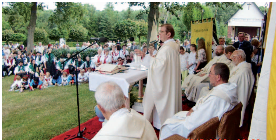
Festgottesdienst mit den Trachtengruppen

In Vorbereitung dieses Jubiläums wurde in der Grundschule Wingerode ein Malwettbewerb zum Thema Eichsfelder Trachten